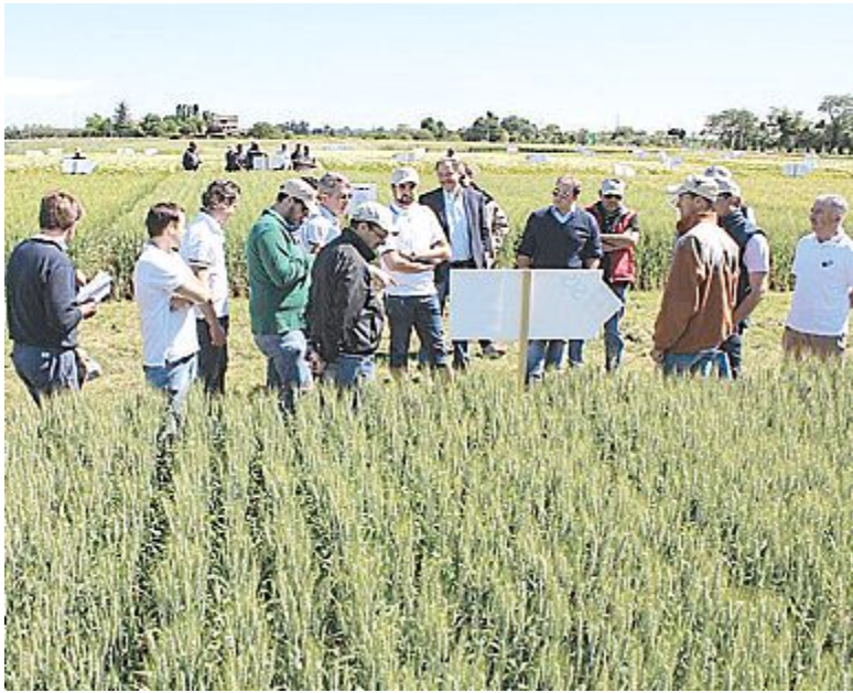
NEI CAMPI Grande successo per l'iniziativa della Sis

CASTELLO, LA BIBLIOTECA CHIUDE PRIMA OGGI LA BIBLIOTECA DI CASTEL SAN PIETRO CHIUDERÀ ALLE 12 (ANZICHÉ ALLE 12,30) PER LAVORI DI RIPRISTINO AL PAVIMENTO DELL'INGRESSO