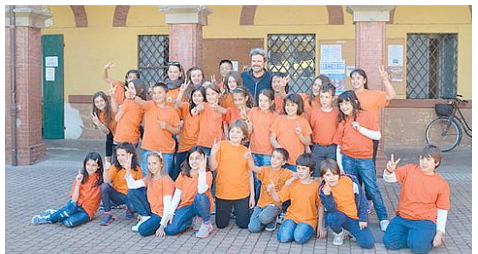
SCHIERATI I ragazzi di medie ed elementari che compongono il coro